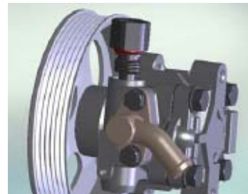
اورینگ کانکتور به شماره فنی 01715012

1-5- سرنگ حاوی مایع شوینده (الکل یا TCE) را با فشار از اسپول و سوراخ بغل اسپول عبور دهید. آلودگی های روی صافی را با شناور کردن اسپول داخل مایع شستشو و تکان دادن آن برطرف نمایید. توسط فشار باد اسپول را کاملاً تمیز نمایید.